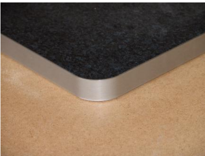
Dickkante belegen auf Rundungen und Vorderkanten 17,00 €/lfm (incl. Dickkante) Rundung fräsen 15,00 €