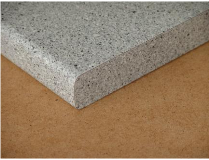
Schichtstoffkante seitlich belegen 7,00 €