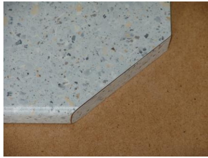
Schichtstoffkante über Abschrägung 18,00 €