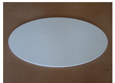
Tischplatte fräsen und Dickkante stoßen 40,00 € mit Dickkante belegen 17,00 €/lfm (incl. Dickkante)