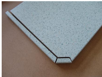
Postformingkante einsetzen über Abschrägung 50,00 € zzgl. Material für Postformingkante (22,00 €/lfm)