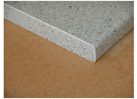
Dickkante seitlich belegen 11,00 €