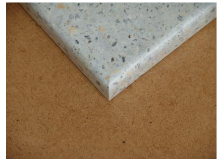
Postformingkante einsetzen 90° 35,00 € zzgl. Material für Postformingkante (22,00 €/lfm)